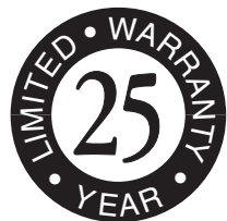
Elite Glass-Seal ®

CONSERVE ESTA GARANTÍA LIMITADA Y EL/LOS RECIBO(S) DE SU CONTRATISTA PARA REFERENCIA FUTURA